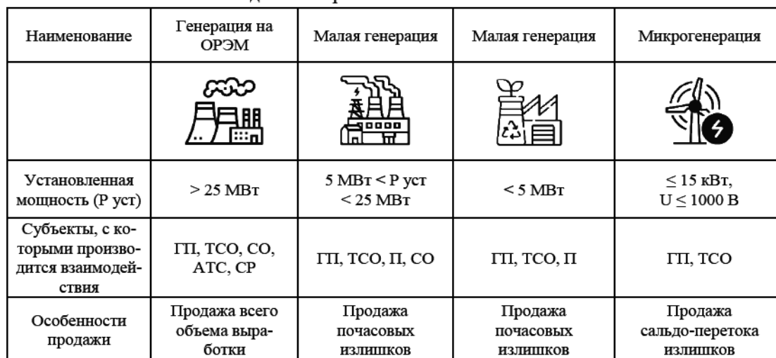
Таблица 1 – Группировка систем генерации электроэнергии возможных к присоединению к Единой энергетической системе России

В настоящий момент группировка систем генерации электроэнергии возможных к присоединению к Единой энергетической системе России состоит из четырех основных групп, представленных в таблице 1.